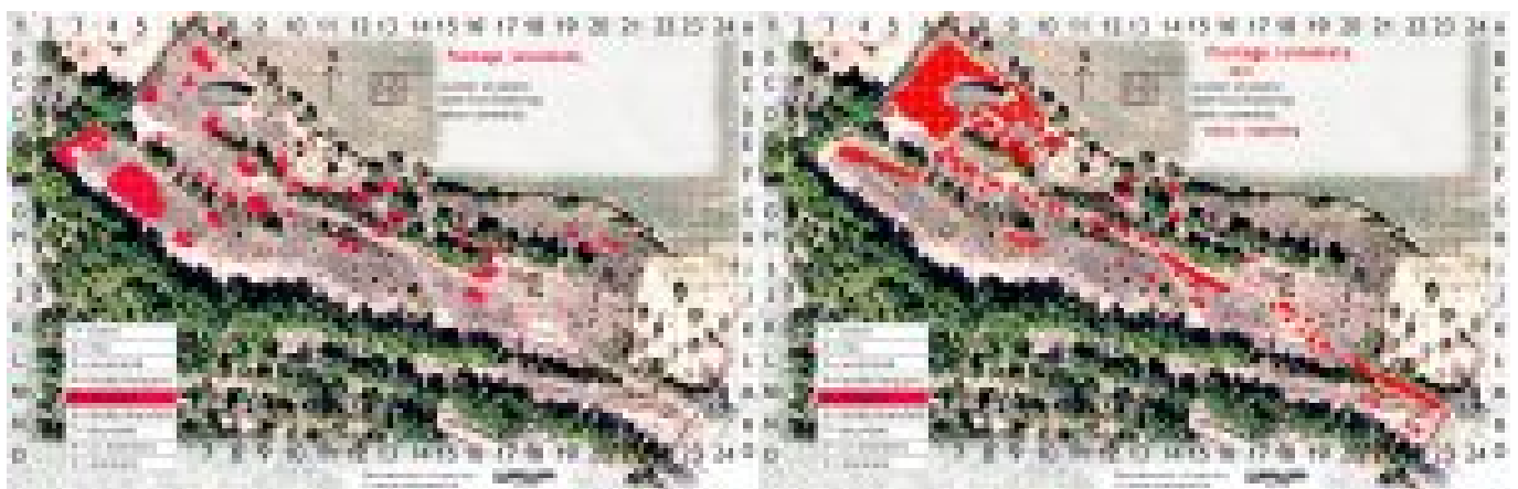
Lo mismo para Plantago lanceolata .